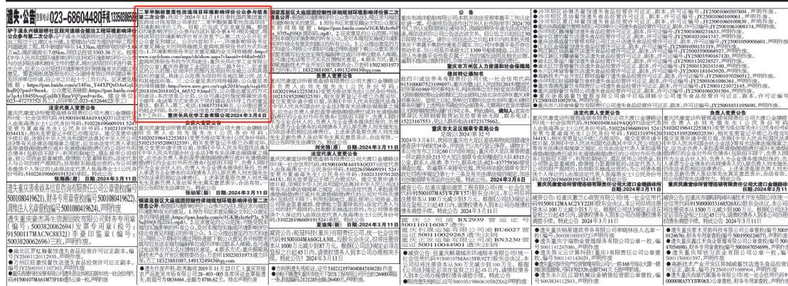
图 3-3 2024 年 3 月 11 日报纸公示情况