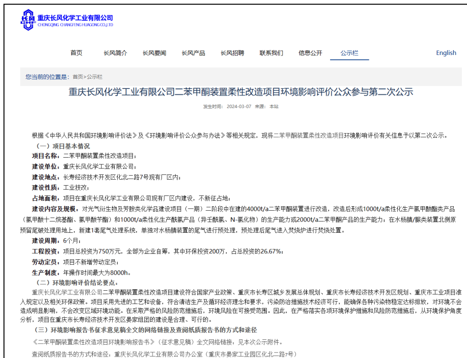
图 2-1 第二次信息公示情况

我公司在重庆长风化学工业有限公司网站（www.cfchem.com）上发布了征求意见稿公示信息，对环境影响报告书征求意见稿全文进行公开，公示时限为5个工作日，网站第二次公告截图见图3-1。